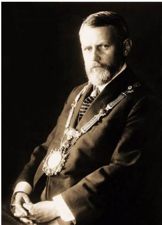
Prof. Ing. Emil Votoček

Štvrtou oblasťou práce prof. Votočka bola je pedagogická činnosť. Je autorom viacerých učebníc organickej chémie, spolu s prof. Heyrovským vytvorili učebnicu anorganickej chémie . Vychoval plejádu vedeckých pracovníkov, ktorí získali svetové uznanie a z ktorých treba uviesť aspoň akademika Otta Wichterleho (1913 – 1998), vynálezcu kontaktných šošoviek. Ako pedagóg a skúšajúci bol veľmi prísny, jeho princíp „ každý, kto neumí na výbornou, ať raději odejde “ bol príslovečný.