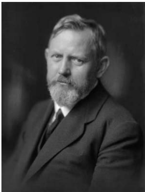
Prof. Ing. Emil Votoček